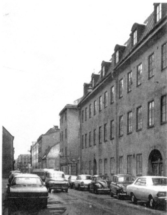
Luntmakargatan norrut från Tunnelgatan